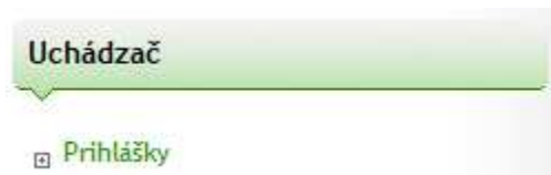
Obr. č. 2: Prihlášky

Po uložení osobných údajov kliknite na „Prihlášky“ v menu „Uchádzač“ (obr. č. 2).